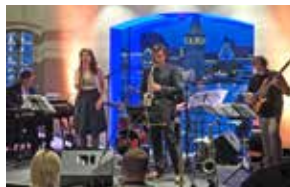
Sommerjazz 2017

Juni / Juli / August 2019 | 20 Uhr Sommerjazz Jazz- und Populärmusic