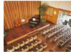
Forum am See, Kirschbaumsaal

Samstag | 30. November 2019 | 19 Uhr Lindau | Forum am See | Brettermarkt 10 Lange Nacht der Musik 2019