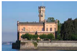
Schloss Montfort | Langenargen

»Fetzig Rhythmen, toller Gesang, herrliches Ambiente... Das beflügelte Ensemble macht Musik auf höchstem Niveau und von größter Perfektion, die gleichzeitig mit lässiger Nonchalance daherkommt...«