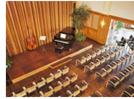
Forum am See, Kirschbaumsaal